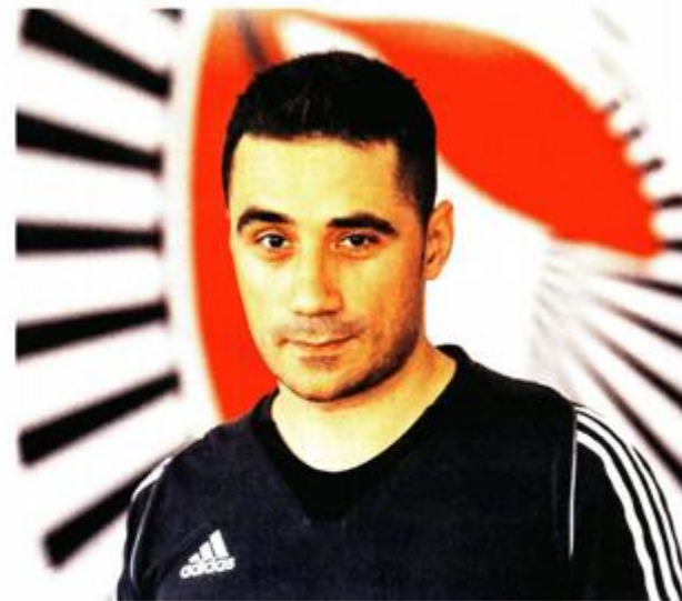
Zahvaljujući donatorima opremili su sportsku dvoranu na zagrebačkom Črnomercu