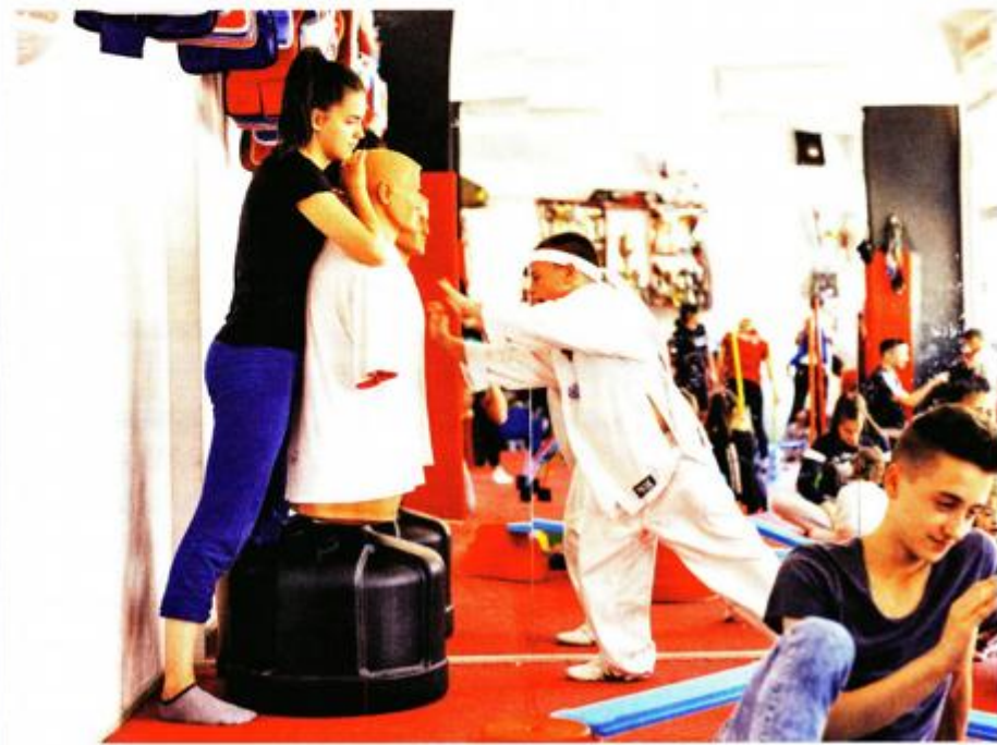
Ako se neko dijete pokaže vrlo napredno, pripremaju ga za natjecanje

Kaže i da mu je znanje iz medicine puno pomoglo u radu s ljudima s posebnim potrebama.