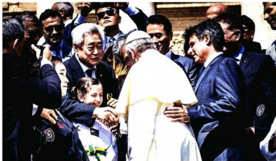
NA TRGU SVETOG PETRA U VATIKANU PAPA FRANJO PRISUSTVOVAO JE DEMONSTRACIJI VJEŠTINA TAEKWONDOA

"U Siriji nismo neposredno prisutni, ali zato podučavamo taekwondou izbjeglice u izbjegličkim