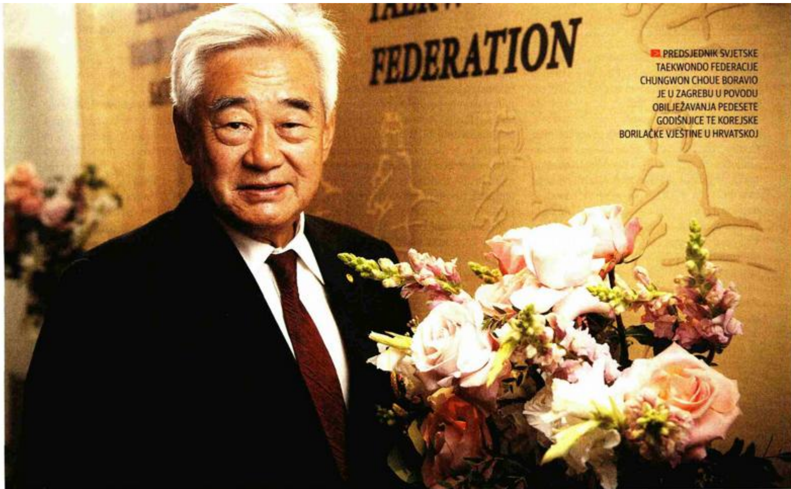
PREDSJEDNIK SVJETSKE TAEKWONDO FEDERACIJE CHUNGWON CHOU BORA VO JE U ZAGREBU U PO VODU OBILJEŽAVANJA PEDESETE GODIŠNICE TE KOREJSKE BORILAČKE VJEŠTINE U HRVATSKOJ

Tekst DRAGAN ĐURIĆ